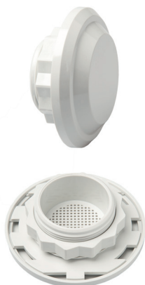
Фото: вид изнутри